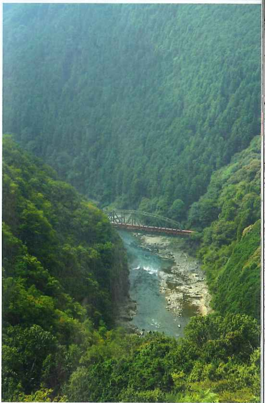
嵐山・高雄パークウエイ P18 MAP① 京都市街からクルマで約30分。気軽なドライブコースとして市民にも親しまれ、ファミリーで楽しめるレジャー施設も充実。保津峡展望台からは、毎時16分と48分に、トロッコ列車が通過する光景を見下ろすことができる(下)。 ☎075-871-1221(高雄事務所) ⑧8:00~20:00(入場は~19:00) ⑨無休 ⑩軽、小型普通自動車1,180円 ※17:00~は590円(税込)