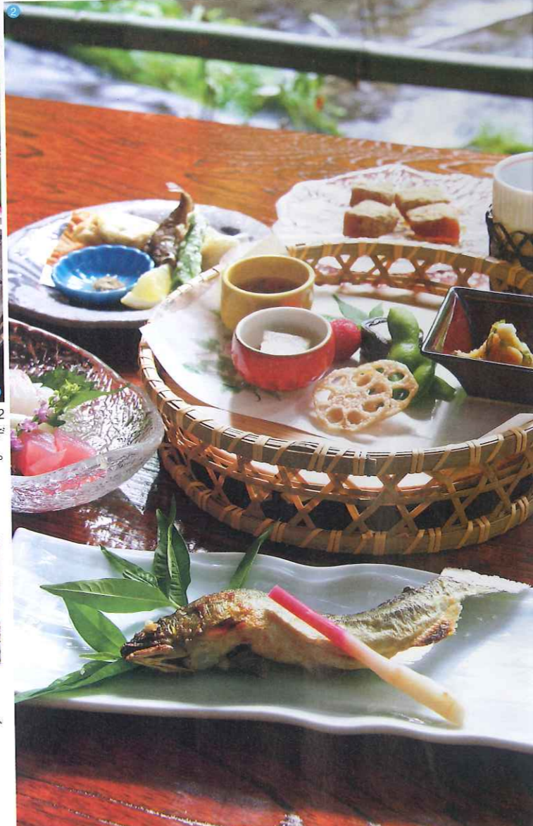
①飛沫を上げる涼しげなせせらぎに、思わず足を下ろしたくなる。②昼のみ提供の7,452円コース(八寸、スープ、お造り、鮎の塩焼き、素麺、揚げ物、南蛮漬、ご飯、香の物、デザート)。③京都の夏の味覚といえば鮎。梅肉が爽やかな鮎落とし(単品2,100円/税込)。④随所に吊られた提灯も風情豊か。