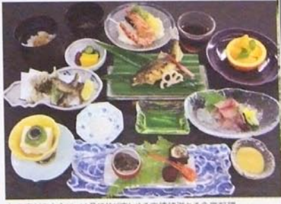
旬の素材を中心に、10品ほどが楽しめる京情緒溢れる会席料理「お昼のおまかせコース」7,245円(税込) ※7・8月の土日祝日・お盆を除きます。要予約。