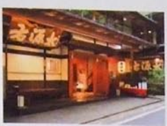
どっしりとした造りの右源太。2階には貴船川を見下ろしながら食事を楽しめる部屋がある。