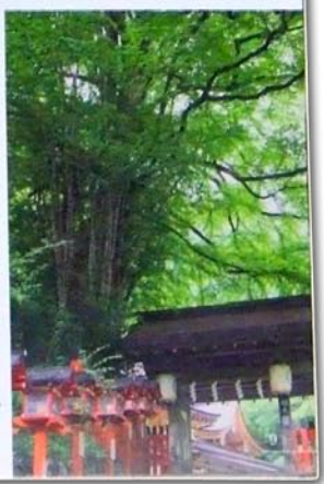
樹齢400年。空に広がる緑が美しい御神木。