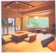
囲炉裏のテーブルがある和室。部屋はメゾネットタイプになっていて、2階には露天風呂も。