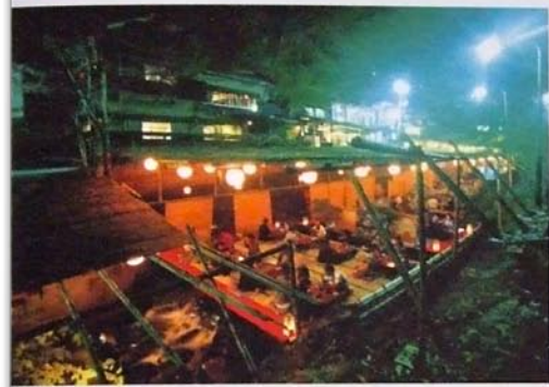
夜は提灯がとまり、昼とは違った風情がある川床。貴船では、川のすぐ上に床が組まれるところから「かわどっこ」と呼ばれる。ちなみに、高雄や鴨川では、高床(ゆか)式スタイルなので「かわゆか」だそうだ。