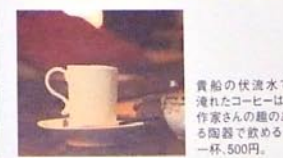
貴船の伏流水で淹れたコーヒーは、作家さんの趣のある陶器で飲む。一杯、500円。