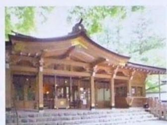
古くから水の神として信仰を集める貴船神社。縁結びや心願成就の御利益もある。

30分ほど歩くと、朱塗りの大鳥居が、趣のある参道を登ると、御神木「桂の木」に迎えられます。ここが、貴船神社本宮、気持ちのいい「気」に包まれています。創建は平安遷都以前といわれており、賀茂川の上流であることから「都の水を司る神」として崇められてきました。 社殿前には、山から湧き出た御神