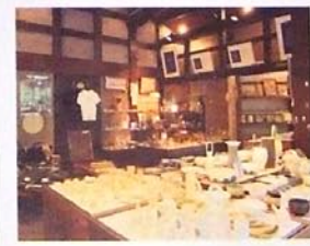
古民家らしい落ち着いた雰囲気のギャラリー。50名ほどの作家さんの作品を展示・販売している。

ちょっと休憩をといたら、貴船ギャラリーはいかが？ 滋賀県余呉にあった庄屋を移築したギャラリーは、天井に太い梁がわたる堂々とした建物。陶器や布など、作家さんの作品を眺めてもいいし、山々と向かい合うように設けられたカウンター席でいただく一杯のコーヒーは格別です。