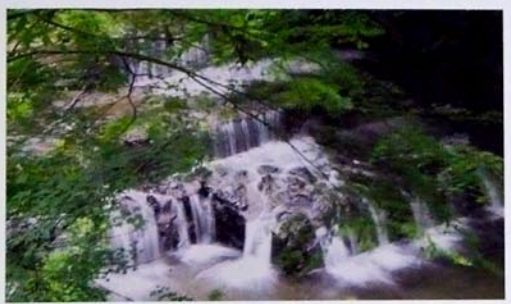
「水源の森百選」にも選ばれた貴船。貴船川は鴨川の源流のひとつ。

ところで、貴船の地名の由来は「気生根」「気生嶺」。大地のエネルギー「気」が生ずる山、その根源の場所という意味だそうです。確かに、町中の暑さやうそのような清々しさ、そびえる杉や