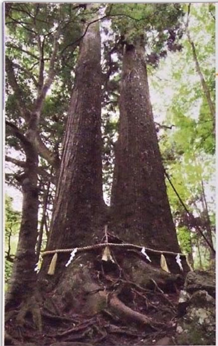
同じ根から生えた2本の木が寄り添うように立つ相生の杉。その姿が仲睦まじい老夫婦にたとえられる。