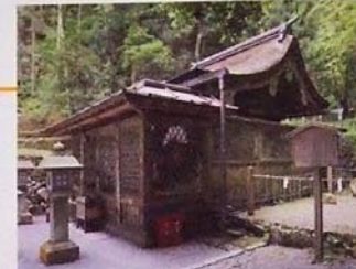
貴船神社本宮から500mのところにある。現在は奥宮となっているが、元はここが本宮。